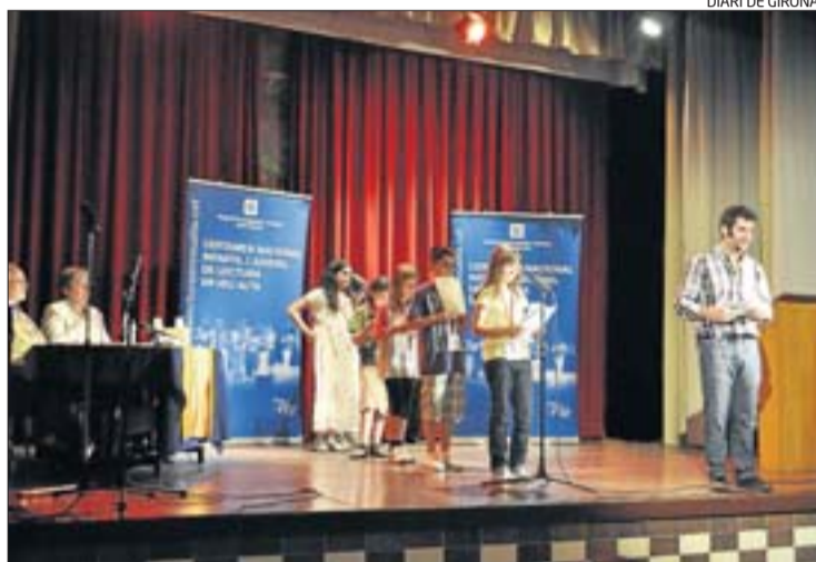
DIARI DE GIRONA

► Les llegendes són històries fantàstiques vinculades al territori. Tots els pobles de Catalunya tenen les seves pròpies llegendes. Des de fa segles, s'han transmès de generació en generació i formen part de la nostra cultura. El llibre les recull. DdG