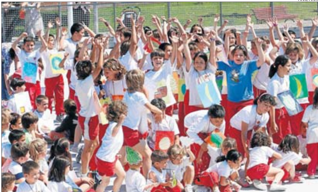
Les nenes i els nens de l'escola Santa Margarida durant la jornada de cloenda del projecte, divendres.

Durant el segon trimestre, es van realitzar múltiples activitats de recerca en l'àrea de naturals, encaminades a inculcar coneixements i a fer que els escolars siguin autònoms en l'àrea d'una alimentació sana. Per això, se'ls va explicar quins són els aliments que aporten els nutrients diaris més importants i necessaris perquè l'organisme pugui fer totes les funcions, en què consisteix la piràmide de l'alimentació, la dieta mediterrània, les sals minerals i les causes i les conseqüències que pot tenir pel nostre cos no seguir les pautes per a una alimentació sana i equilibrada. Aquests continguts s'han treballat a l'aula i en