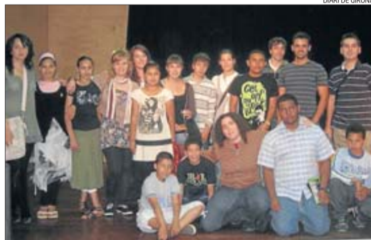
Els estudiants que han realitzat el projecte Rossinyol a Girona.

Aquest projecte es desplega gràcies als compromisos i responsabilitats compartits entre la UdG i els enllaços territorials (LICs, educadors socials, tècnics d'educació i el responsable de centre educatiu, ja sigui tutor, tutor de l'aula d'acollida, mestre, etc).