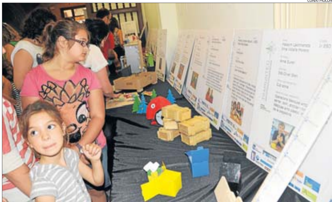
Uns alumnes observen els panells amb les explicacions dels treballs realitzats als diferents cursos d'ESO.

El Servei Educatiu de l'Alt Empordà –depenent del Departament d'Ensenyament– i el grup de treball tramunTEC han explicat que amb aquesta mostra pretenen fer arribar a l'alumnat, professorat, famílies i a la societat empordanesa en general, els aprenentatges de Tecnologia que treballa l'alumnat d'ESO al llarg de tota l'etapa.