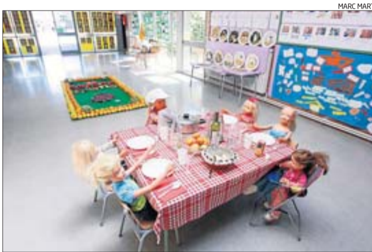
Un muntatge de l'exposició relacionada amb l'alimentació sana.

xerrades per cicles dirigides per una biòloga de la UdG, Anna Prat.