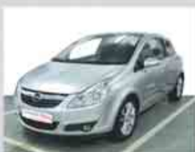
OPEL CORSA 1.4 90 CV 3P SOSTRE Any 2007 8.900 €