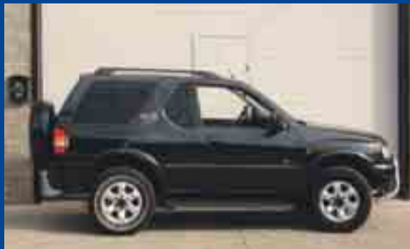
3.100 € OPEL FRONTERA 2.2TDI. ANY 01