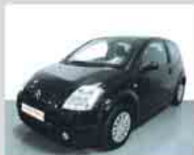
CITROËN C2 1.4 HDi FURIO 70 CV Any 2007 7.900 €

> Totes les marques i models > Finançament a la seva mida > Vehicles totalment revisats > Garantia Selecció XXI