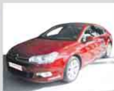
CITROËN NOU C5 HDI 170 CV EXCLUSIVE PACK CUIR Any 2008 27.500 €