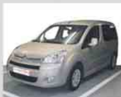
CITROËN NOVA BERLINGO HDI 90 CV SX MULTIS. Any 2009 14.800 €