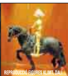
REPRODUCCIÓ FIGURES KLIMT, DALÍ...