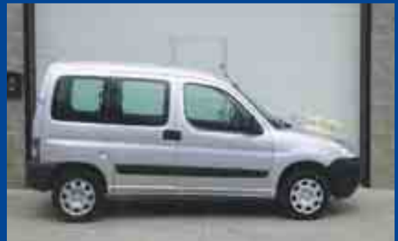
7.900 € PEUGEOT PARTNER 1.9 D. ANY 06