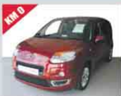
CITROËN C3 PICASSO HDI 90 CV EXCLUSIVE 17.700 €

APROFITA EL NOSTRE "NOU PLA PREVER" de V.O. a