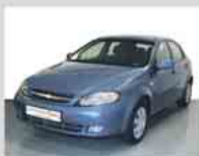
CHEVROLET LACETI 2.0 TCDI 120 CV 5P Any 2007 7.500 €