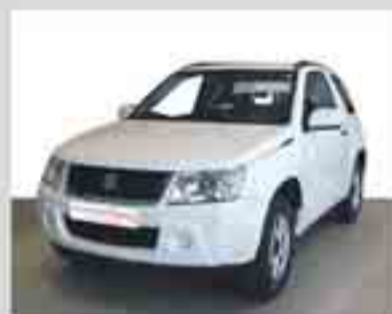
SUZUKI GRAND VITARA 1.9 DDIS 125 CV 3P Any 2008 15.800 €