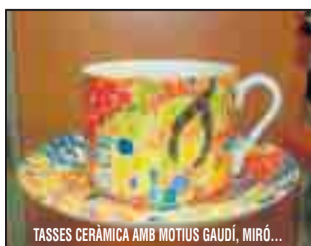
TASSES CERÀMICA AMB MOTIUS GAUDÍ, MIRÓ...