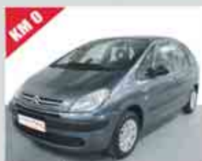
CITROËN XSARA PICASSO 1.6 HDi 110 CV LX 16.300 €