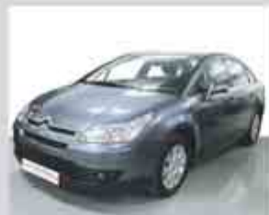
CITROËN C4 SEDAN EXCL. 1.6 HDi 110 CV Any 2008 15.900 €