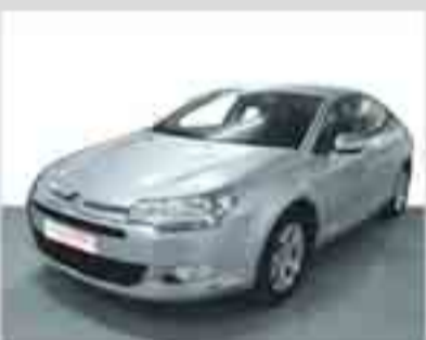
CITROËN NOU C5 HDI 110 CV PREMIER Any 2008 18.500 €