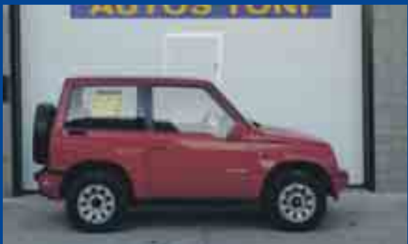
SUZUKI VITARA 1.6 JLX. ANY 93

COMPRAVENDA DE VEHICLES NOUS, D'OCASIÓ I KM 0 - VEHICLES SENSE CARNET FINANÇAMENT A LA SEVA MIDA, SENSE ENTRADA I GARANTIA FINS A 12 MESOS