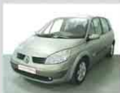
RENAULT SCÉNIC II 1.5 DCI 80 CV Conf. Authent. Any 2005 9.300 €