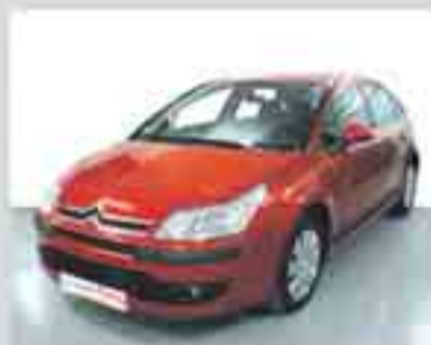
CITROËN C4 1.6 HDi 110 CV COLLECTION Any 2008 11.500 €