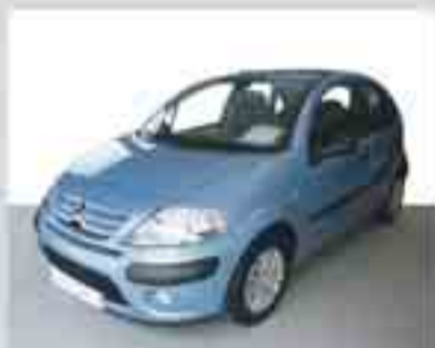
CITROËN C3 1.4 HDi 90 CV COOL Any 2008 10.500 €