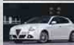
ALFA ROMEO GIULIETTA

Els cotxes seleccionats com a candidats són: