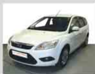
FORD FOCUS WG 1.6 TDCI 90 CV TREND Any 2008 12.100 €