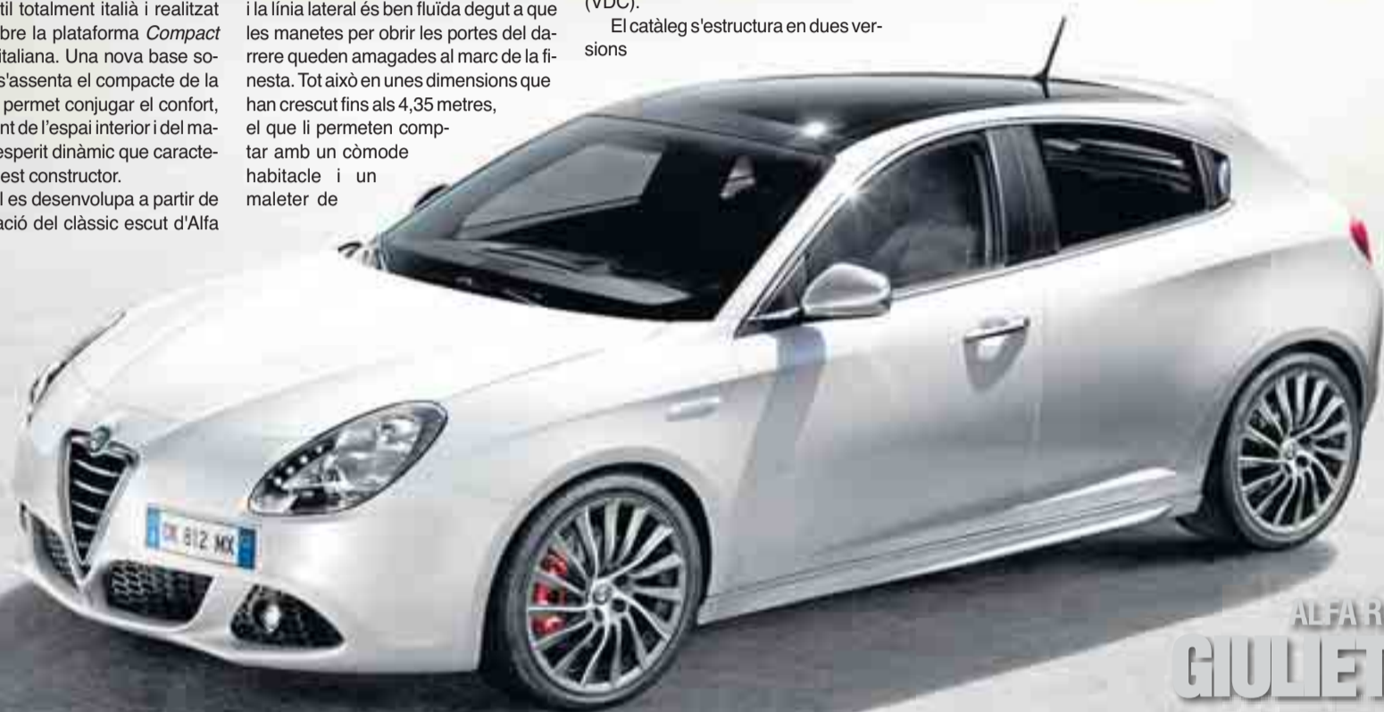
ALFA ROMEO GIULETTA

La dotació de sèrie també inclou el climatitzador manual, llantes de 16 polzades, volant de pell, vidres elèctrics davanters i del darrere, ordinador de viatge, equip d'àudio estèreo amb 6 altaveus i reproductor de CD MP3. DdG