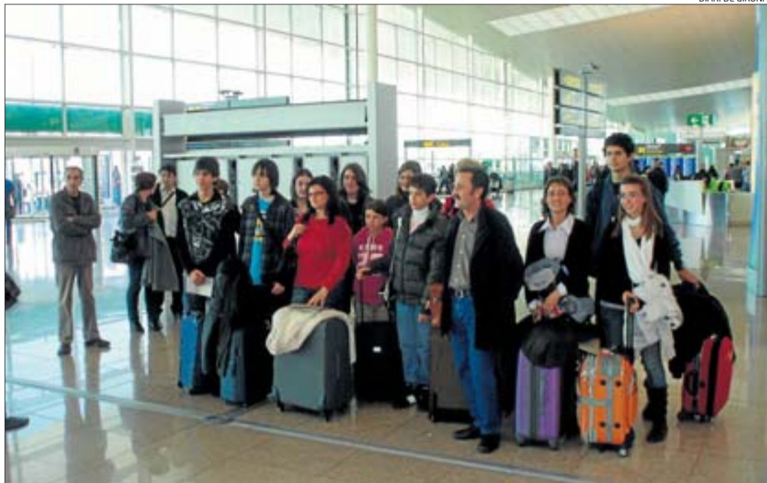
La delegació de l'institut d'educació secundària Baix Empordà que va viatjar a Copenhaguen.