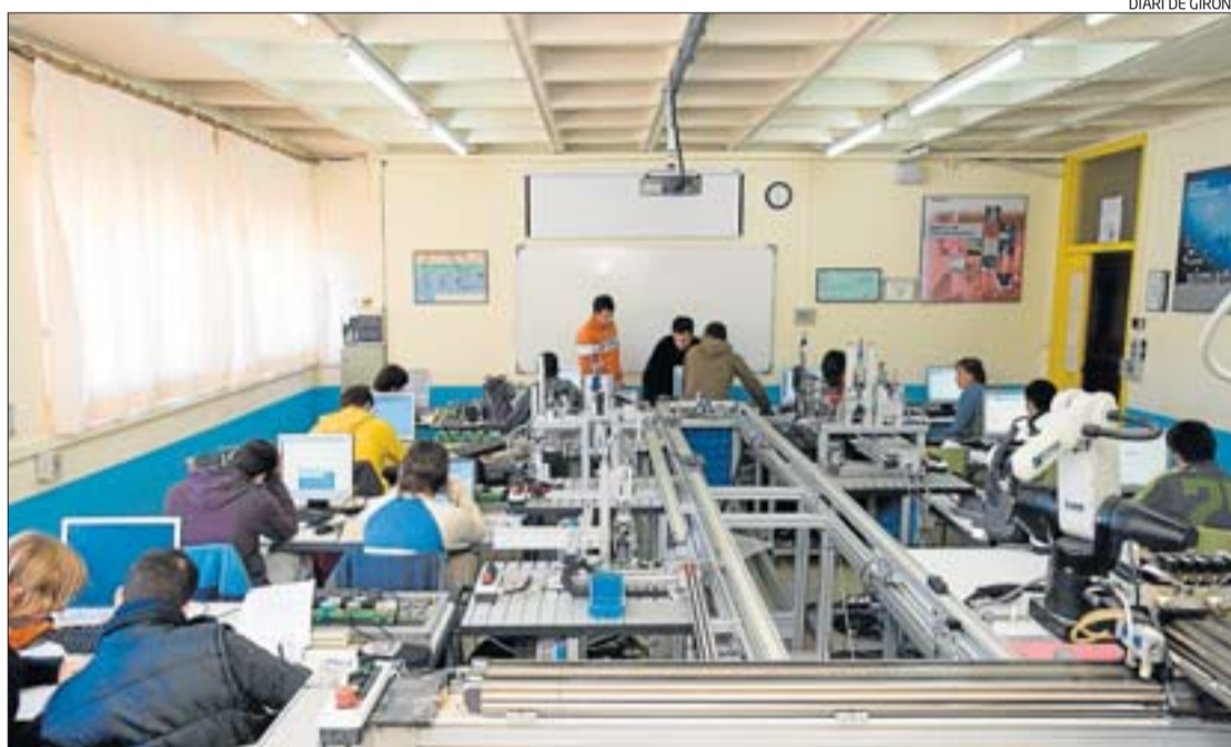
Estudiants treballant en una aula de formació professional, en un institut d'educació secundària d'Olot.

L'estudi també mostra que el 62,18% dels graduats mitjans decideix preparar les proves per accedir a un grau superior. Pel que fa